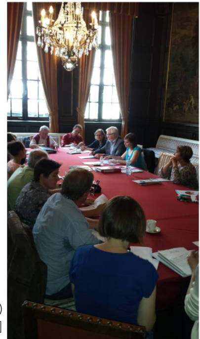
Réunion de travail VADA à Mons (Belgique)