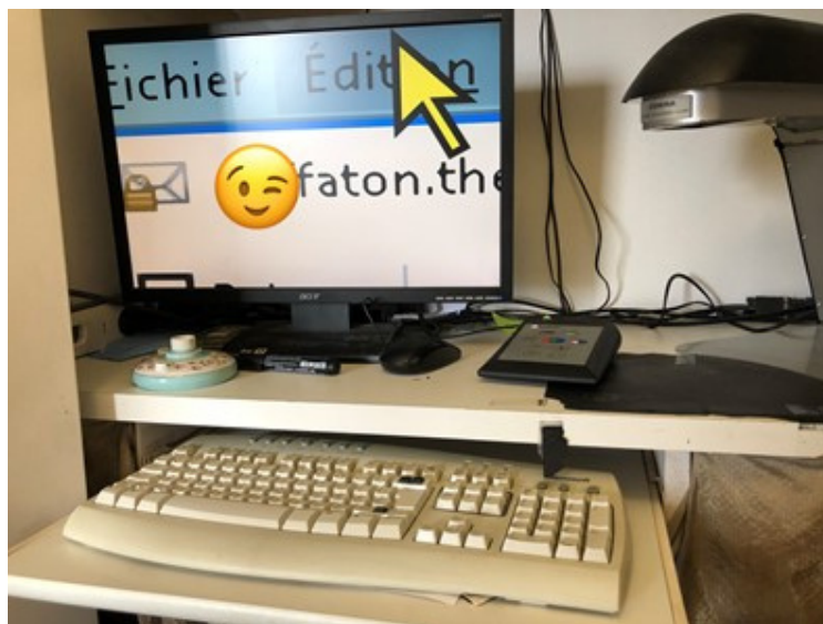
Logiciel permettant à une dame âgée malvoyante d'agrandir le contenu de son écran

Sophie Colas mène une recherche sur le rapport au numérique des personnes de plus de 75 ans. Depuis le début de son doctorat, elle entreprend de documenter les pratiques de l'internet des plus âgé.e.s, que ces pratiques soient régulières, ponctuelles et/ou difficiles, temporairement interrompues ou encore complètement absentes. Elle s'interroge sur la manière dont le numérique s'inscrit dans le quotidien des plus âgé.e.s en suivant notamment un petit groupe d'individus de près. L'objectif de son travail est de comprendre comment se vit le vieillissement et la vieillesse dans une société (de plus en plus) fortement numérisée. Comment le grand âge, avec ce qu'il implique en termes d'expériences de vie passées, de connaissances, mais aussi d'éventuels changements corporels et sensoriels, influence la manière d'utiliser les technologies numériques, ou de quelle manière les transformations sociétales, telles que la digitalisation croissante des démarches administratives ou du commerce sont sources de changements pour les plus âgé.e.s en ce qui concerne l'usage des technologies numériques, sont autant de questions qui traversent sa recherche.